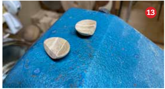
13 De oortjes. Deze worden later op de kop gelijmd met behulp van cocktail prikkers en seconden lijm.