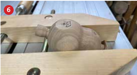
6 Het lijf wordt in een houten lijmtang geklemd en zo zuiver mogelijk afgesteld.