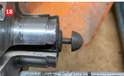
18 De ogen en neus wordt gedraaid van ebben en bloodwood. Het steeltje heeft een diameter van 4mm.