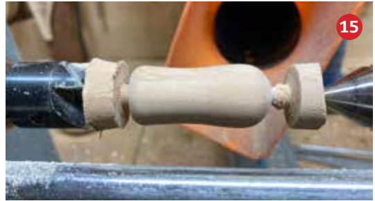
15 De voorpootjes in de juiste vorm gedraaid.