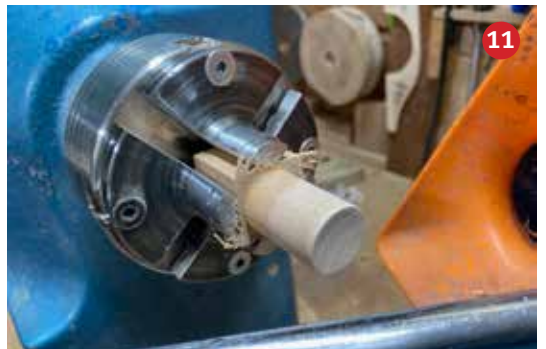
11 De oortjes worden gedraaid ø20mm