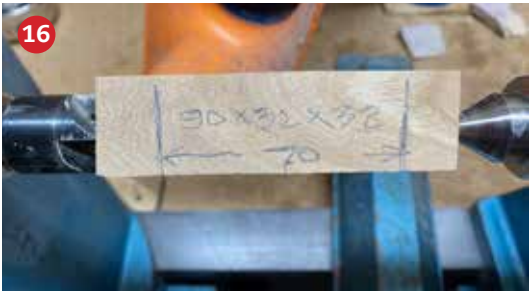
16 Het zelfde wordt gedaan voor de achterpootjes.