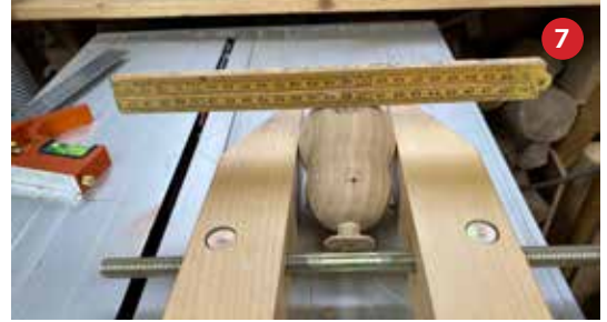
7 en 8 Deze tonen 2 methoden om dit afstellen zo precies mogelijk te doen.