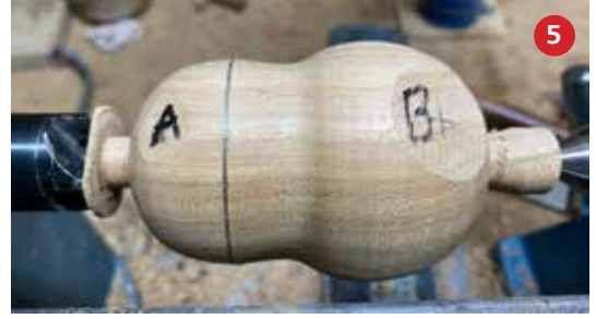
5 Het lijf kan nu verder in vorm worden gedraaid.