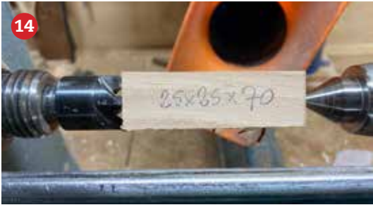
14 Voor de voorpoten wordt een houtje ingespannen 25x25x70mm.