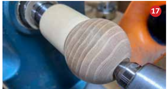
17 Om de kop mooier op het lijf te laten passen ruim ik het gat voor het lijf iets op.