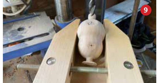
9 Nu kunnen de gaten ø12mm worden geboord voor de voor en achterpoten. Ik doe dit met een kolomboor.