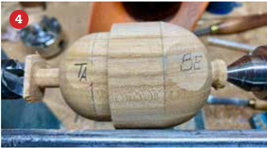
4 De bovenkant wordt ingestoken en rondgedraaid (ø55mm) en de plaats van de pootjes wordt zichtbaar.