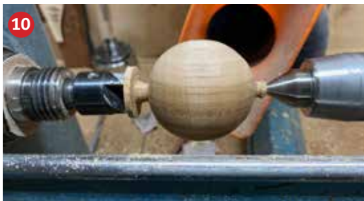
10 De kop wordt gedraaid, afmeting ø60x65mm (eivorm) Hier wordt een gat van ø12mm geboord om de kop op het lijf te plaatsen.