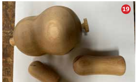
19 De schuinite van de pootjes worden afgetekend.