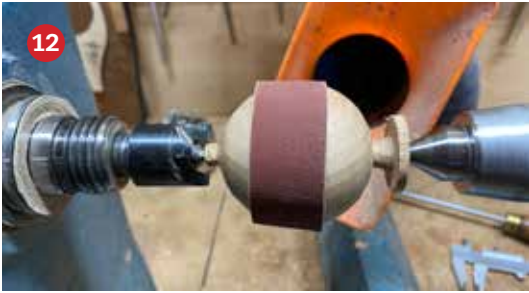
12 Om het hoofd plak ik schuurlijnen met dubbelzijdig plakband om een stukje uit het oor te schuren in de pasvorm van het hoofd.